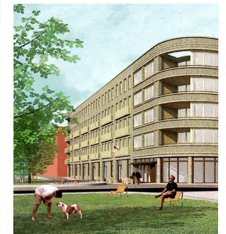
Semi-zelfstandige jongerenwoningen in de Houthaven Met wie ga jij je keukens delen?